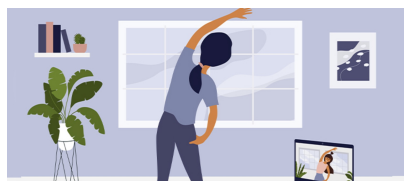
Ce que peut le télésoin pour les patients en kinésithérapie